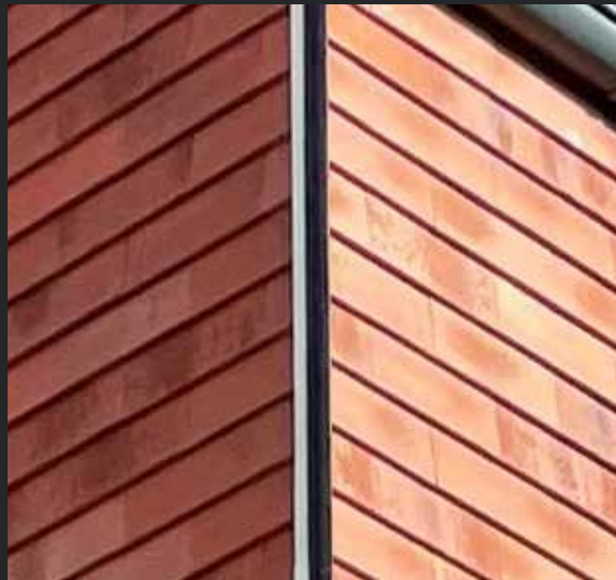
| Außenecke stumpf