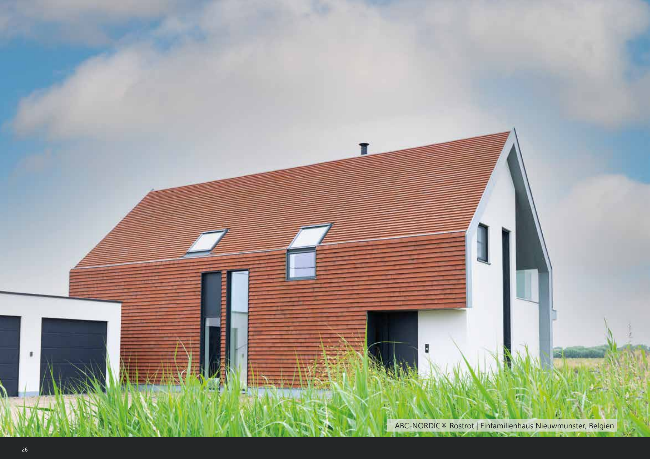
ABC-NORDIC® Rostrot | Einfamilienhaus Nieuwmunster, Belgien