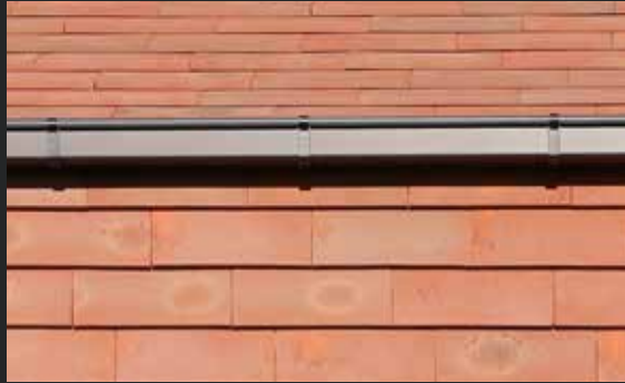
| Kastenrinne vorgesetzt