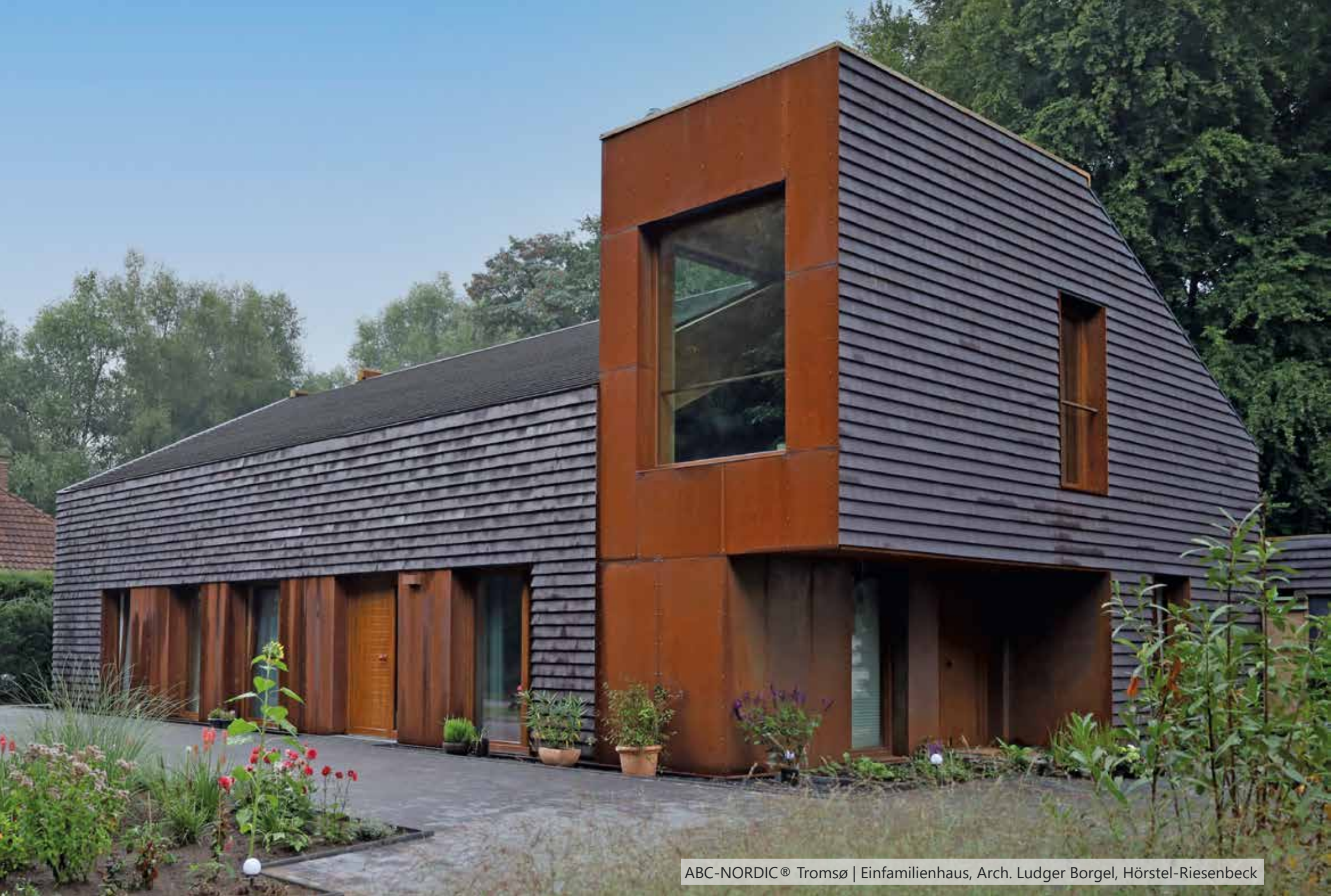
ABC-NORDIC® Tromsø | Einfamilienhaus, Arch. Ludger Borgel, Hörstel-Riesenbeck