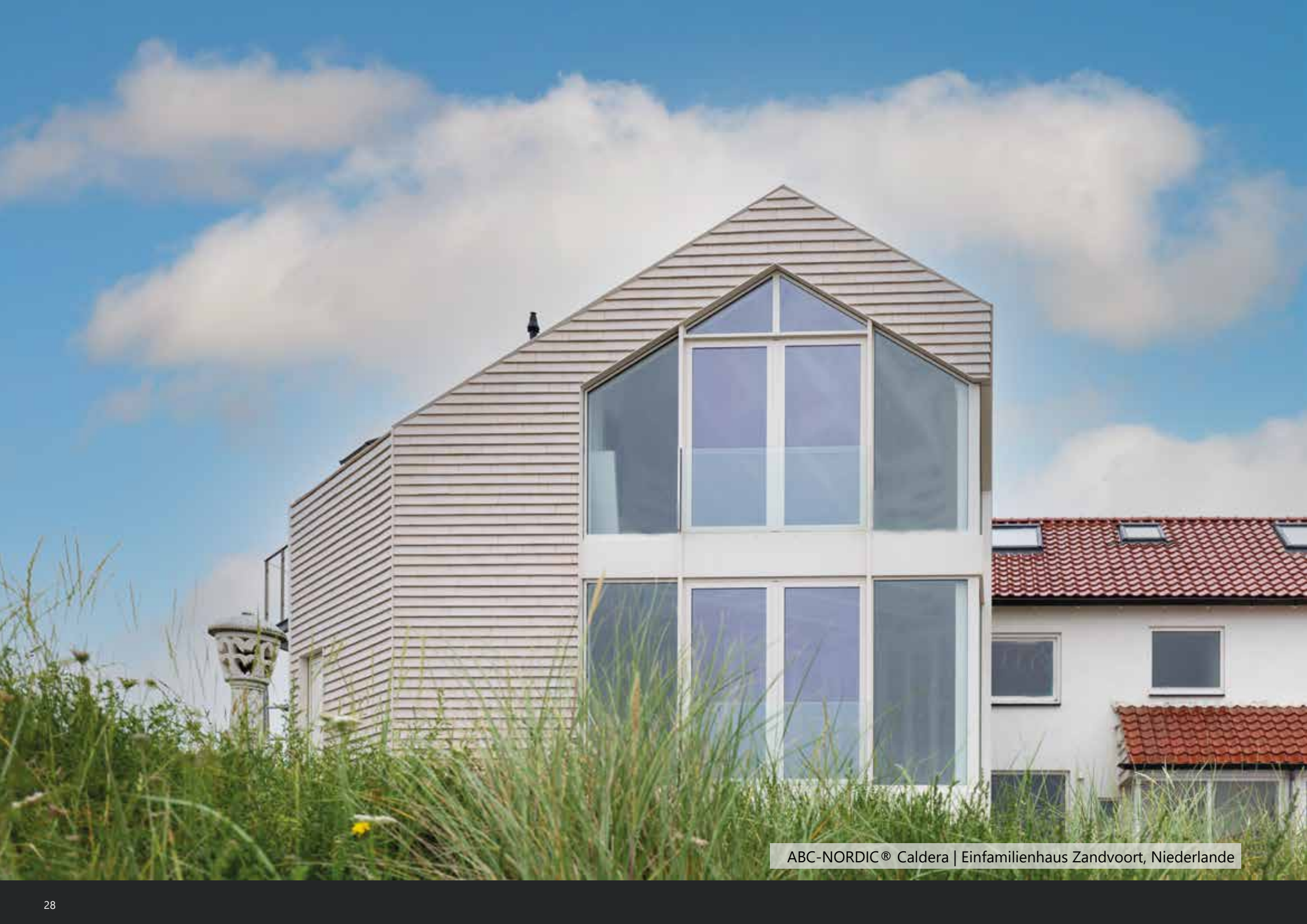
ABC-NORDIC® Caldera | Einfamilienhaus Zandvoort, Niederlande