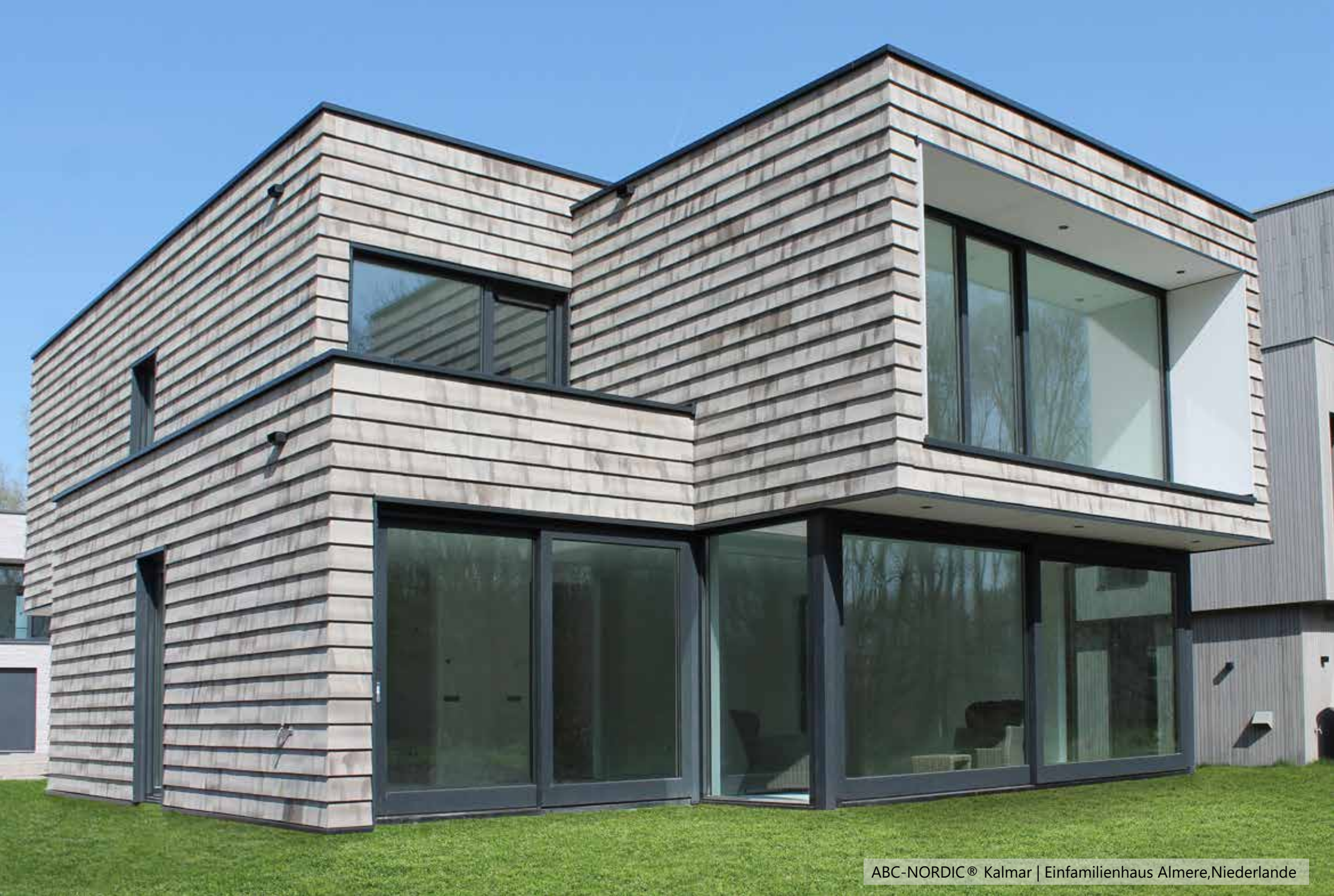
ABC-NORDIC® Kalmar | Einfamilienhaus Almere, Niederlande