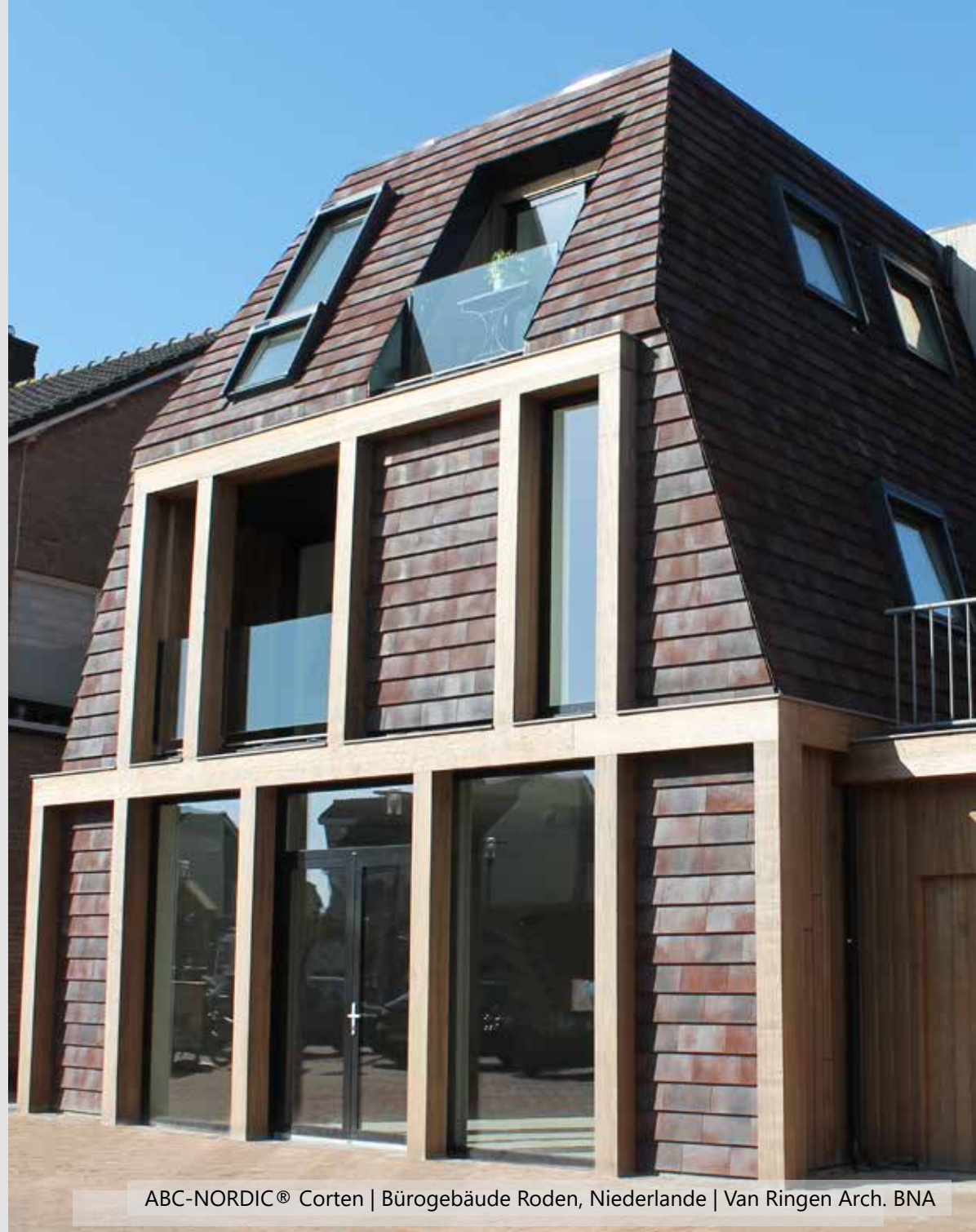
ABC-NORDIC® Corten | Bürogebäude Roden, Niederlande | Van Ringen Arch. BNA