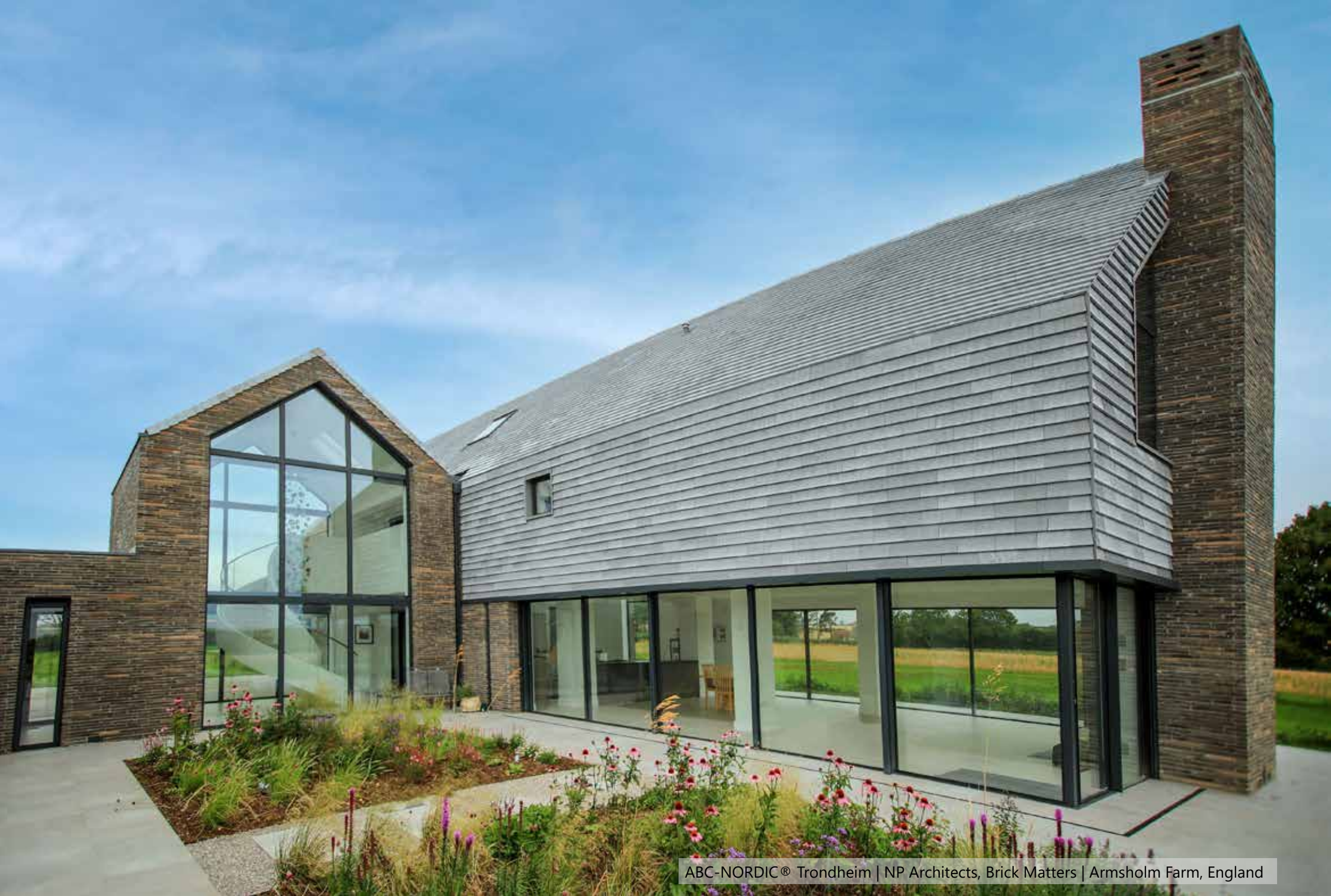
ABC-NORDIC® Trondheim | NP Architects, Brick Matters | Armsholm Farm, England