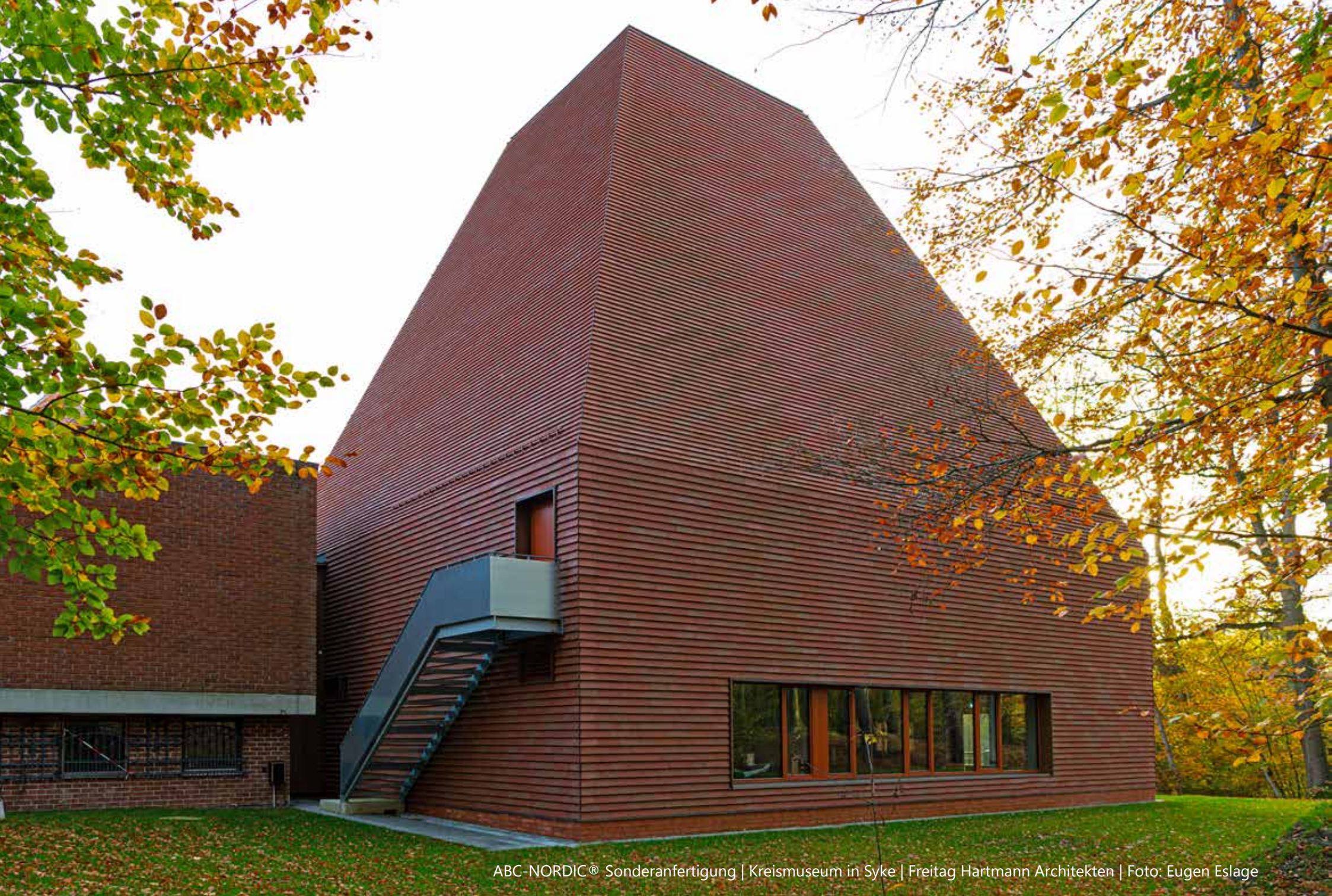
ABC-NORDIC® Sonderanfertigung | Kreismuseum in Syke | Freitag Hartmann Architekten | Foto: Eugen Eslage