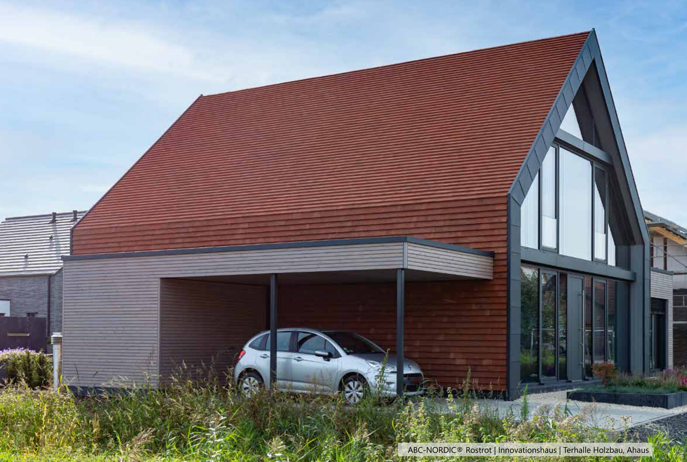
ABC-NORDIC® Rostrot | Innovationshaus | Terhalle Holzbau, Ahaus