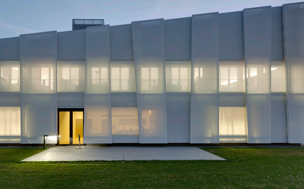
FORSCHUNG- UND ENTWICKLUNGSZENTRUM SEDUS STOLL DOGERN ( links ) BOTSCHAFT FÜR KINDER SOS-KINDERDORF BERLIN ( unten )