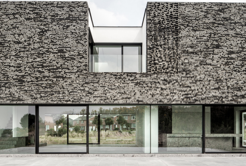
PRIVATHAUS AALST, BELGIEN ( links ) PRIVATHAUS OLMEN, BELGIEN ( unten )