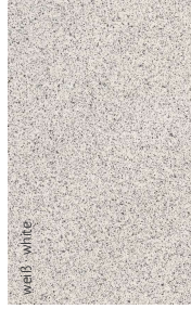
weiß - white