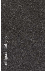
dunkelgrau / dark grey