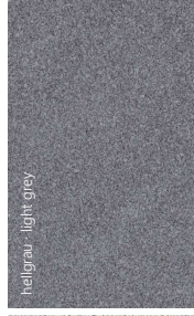
hellgrau - light grey